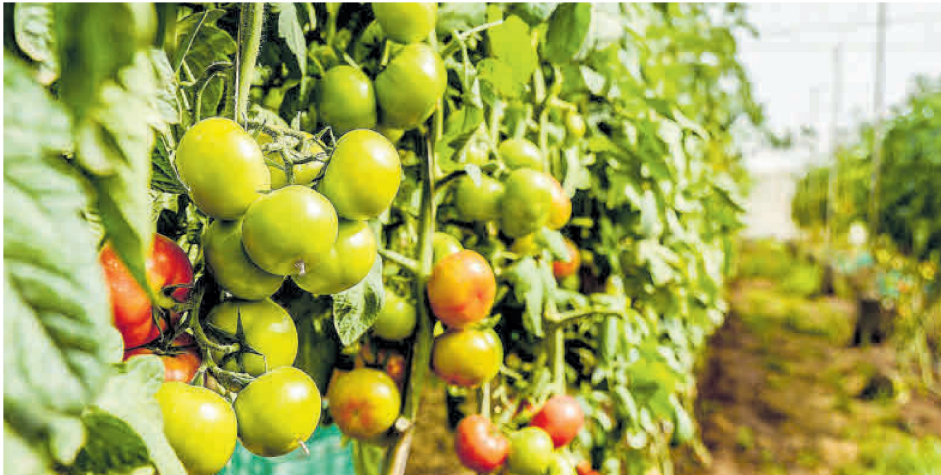
La exportación hortofrutícola es una de las grandes afectadas por el 'brexit'. En la imagen, finca de tomates en Gran canaria. | JOSÉ CARLOS GUERRA